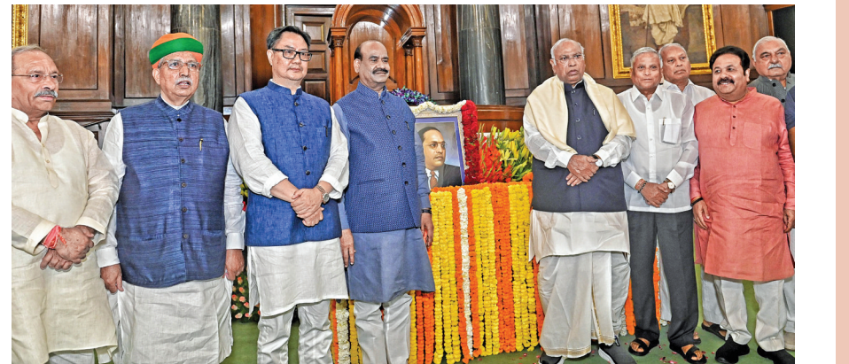
అంబేద్కర్ జయంతి సందర్భంగా మంగళవారం పార్లమెంటులో ఆయన చిత్రపటం వద్ద నివాళులర్పిస్తున్న స్పీకర్ సి.ఎ. బిర్లా, కేంద్ర మంత్రి కిరణ్ రిజిజా, కాంగ్రెస్ అధ్యక్షుడు ఖర్గే తదితరులు