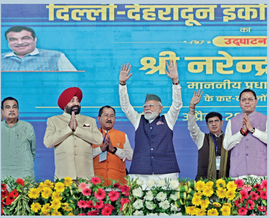
మంగళవారం దెల్లూరూన్లో కారీదార్స్ ప్రారంభించిన ఆనంతరం జరిగిన సభలో అభివాదం చేస్తున్న ప్రధాని మోడీ